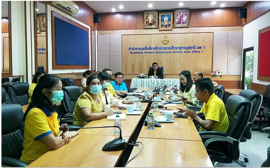
ภาพการประชุมคณะกรรมการขับเคลื่อนการตอบตัวชี้วัด OIT